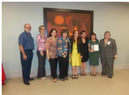
Autoras y colegas

editado por Ediciones SM. Este libro recoge los primeros cinco años de sus columnas periodísticas que, como una aportación de la Cátedra, se publican en el periódico El Vocero de Puerto Rico. En el libro, como muy bien recoge su título, se abordan los temas de lectura y escritura principalmente dirigidos a padres, docentes y público en general.