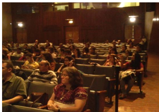
Asistentes a las actividades