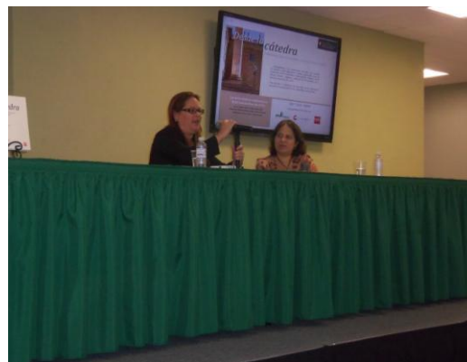
La presentación del libro