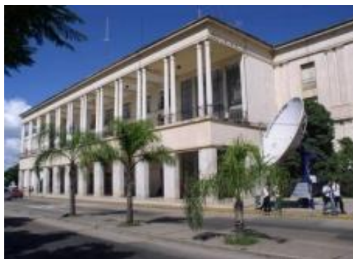
Universidad Nacional de Córdoba, Sede del VII Congreso Internacional de la Cátedra

vías de canalización hacia el trabajo plural de la Cátedra UNESCO.