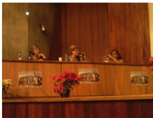
Vista de los participantes en el foro