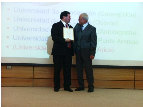
Acto de instalación

Educativos: Investigaciones y Reflexiones desde la Cátedra Unesco de Lectura y Escritura” que tuvo lugar en la Universidad de Magallanes de esa ciudad austral chilena, los días 22 y 23 de agosto ( http://www.umag.cl/vcm/?p=1534 ).