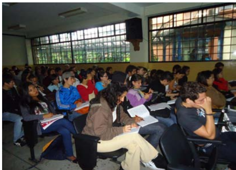
Los estudiantes de Comunicación Social en la Sala de Usos Múltiples de la ULA Táchira